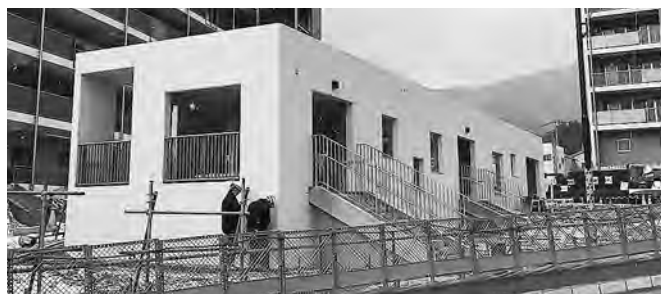
雪の日でも待ち合わせ場所に使えます

答 当初、生活支援課でも集会施設的なものも考えていましたが、周囲に運動場西や換地の部分等が混在する場であるため、一つの行政