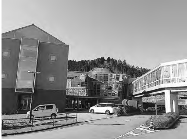
地域福祉センター、医療センター改修は

①地域福祉センター内の保健センター・子育て支援センター移転後の施設活用について検討されていると思いますが、施設活用公表時期は。