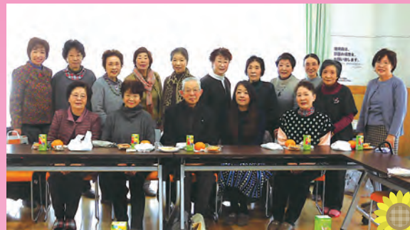
先生を囲んでの新年会(1月12日)