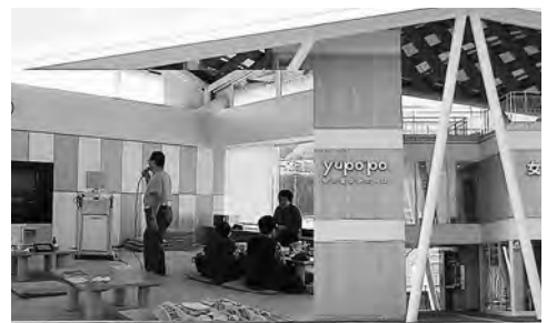
月1回カラオケが歌えることに…

（答） 県でも認めている焼却以外の方法も選択肢の一つ（すき込み、林地還元等）またコンクリート、コンテナ等に半減期の30年、60年と長期管理で自然に放射能の数値を下げていくしかないのでは。