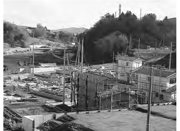
建設が進む(清水地区) 災害公営住宅