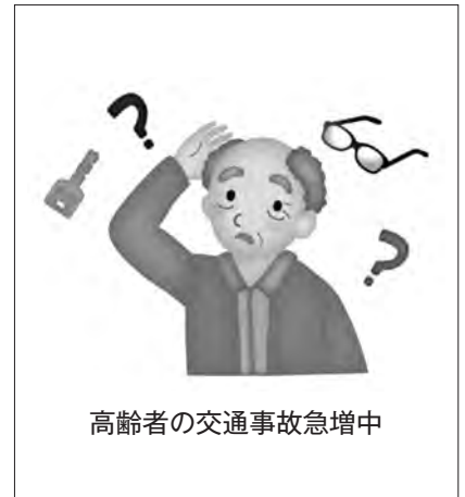
高齢者の交通事故急増中