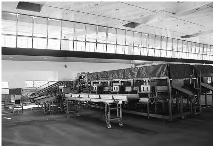
市場内見学通路と選別機材！