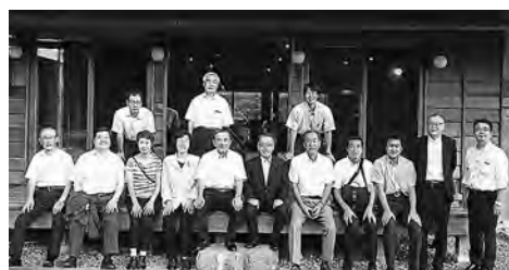
「WEEK Kamiyama」 古民家を改造した宿

本町も少子高齢化が進む中で、若者の定住は未来の地域づくりの必須条件である。本町ではNPO法人アスヘノキボウが「お試し移住」等で定住促進を図っており、町づくりに大きな役割を担っているが、住民に十分理解されているとは言い難い。公と民の連携によってこそ、真の活性化が図られるものであり、「とにかく始めろ」の精神が新たな地域づくりには必要であると考ええる。