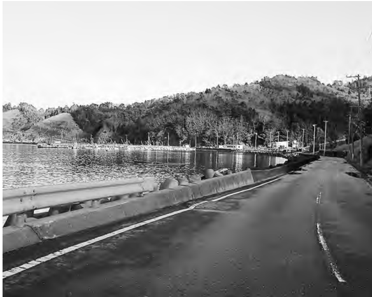
安全に暮らしたい(飯子浜)