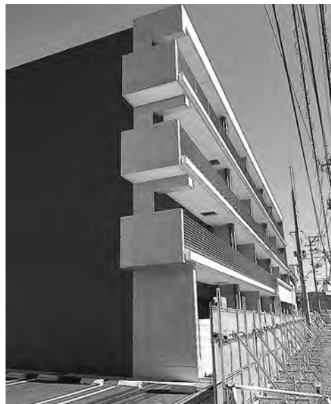
堀切西住宅のみなさん、快適ですか