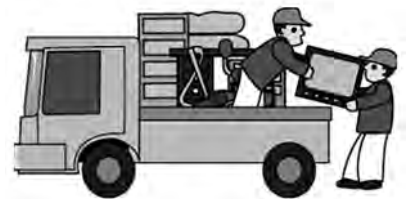
わかりやすい引越し手当ての説明を！

現在、入居者説明会等で制度概要や手続きの説明をしています。一度の説明では理解が得られない場合もあると思います。今後も入居手続きの際に制度概要等について説明するとともに、チラシを作成するなど周知方法にも工夫を凝らし理解の促進に努めます。