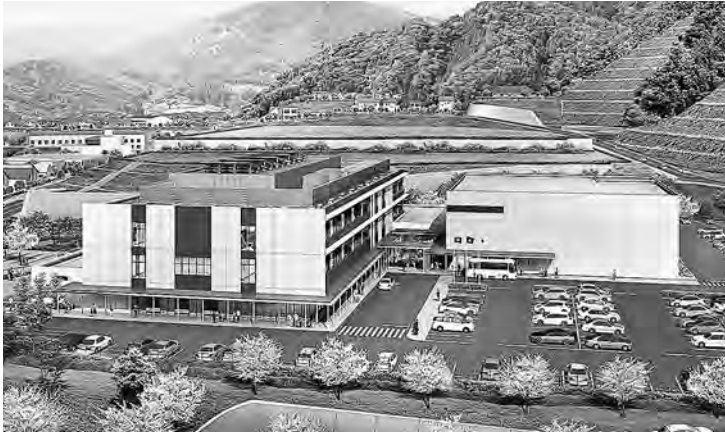
平成30年9月完成へ 役場等4施設

Q 役場等（役場・保健センター・子育て支援センター・生涯学習センター）の整備が、平成30年9月の完成を目指し、進んでいます。