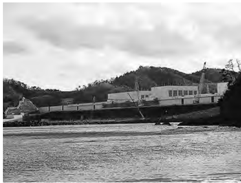
何度も巨大地震に揺すられた女川原発