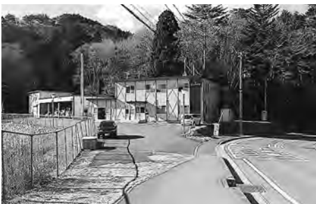
消防仮設庁舎の移転場所、完成年度は

本町では、この指針を踏まえ、緊急時の出勤に効果的な配置などから判断し、小中一貫校移転後の女川小学校グラウンドを建設候補地として調整中であり、配備計画、スケジュールを早期に提示したいと考えています。