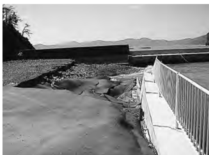
竹浦漁港護岸復旧工事現場

増大著しいイノシシ及びニホンジカの個体数を削減するため、隣接自治体間及び各猟友会等の有機的な広域連携を取ることで、必要な制度の創設と必要な予算処置を求める。