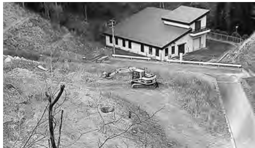
針浜最終処分場～本当に大丈夫？

合と2市1町で通常の焼却灰を受け入れる協定を交わしており、焼却灰を1カ月間受け入れする予定です。