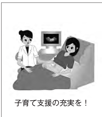
子育て支援の充実を！

②奨学金償還は最長10年間でその償還金が次の人の奨学金に充てられており、奨学金制度を継続する上で確実な償還が重要となっています。償還免除が「持続可能な地域経営」の有効な手段になるかについてはさらに検討を進めます。国で議論している給付型奨学金はその動向を見据え、町として何が実施可能か関係機関で考えていきます。