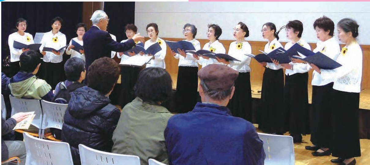
ちょっぴり緊張しながら…(町民文化祭)