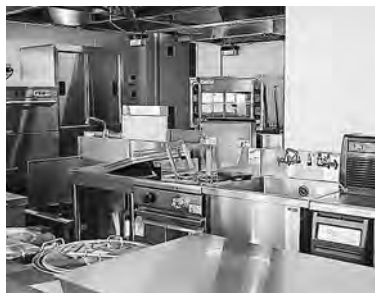
市場食堂は、いつからかな～

①町の「木、花、魚、鳥」は、昭和56年11月に開催された町制施行55周年記念式典で発表、制定されました。理由は町が古くから鯉とともに歩んだ歴史的背景からとされています。 ②町の木、杉は戦後、国の事業で約1840畝、368万本が植林されました。現在は伐採が進み、約1730畝、346万本に減少しています。 桜は、震災前は約1100本を数えましたが、現在は1000本程度となっています。 鯉はピーク時から大幅に減少し、現在は水揚げ数量で約5000トとなっています。 ③これらは、本町の礎を築かれた先人たちの思いや願いが凝縮されたものであり、当面は継続したいと考えています。