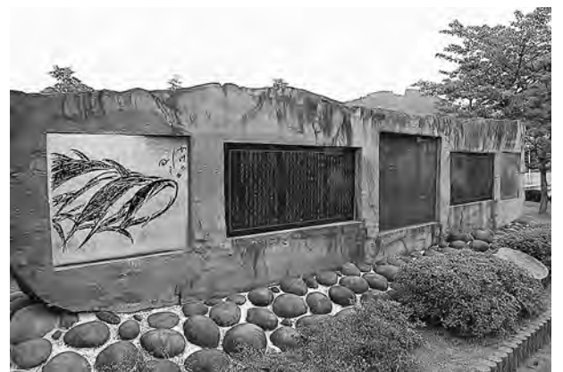
高村光太郎文学碑（震災前）