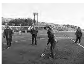
パークゴルフ場が できるといいネ

①現存施設の利用状況は ②陸上競技場は町内的に は必要度は低いと考えま すが石巻広域での視点も 重要です。規模、有り方 等を検討しましたか。 ③県内のパークゴルフ場 は内陸部に偏重し、大半