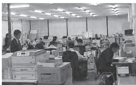
黙々と業務に励む町職員

および職員手当等の引き上げに伴う措置 ・女川牡鹿線整備事業工事施工等業務委託料 3250万円 （飯子浜道路改良工事） ・漁業集落防災機能強化事業業務委託料 1億8727万3千円 （小屋取地区宅地造成に伴う仮設工事等）