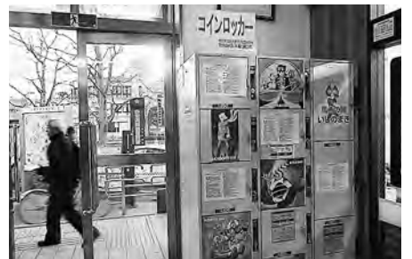
石巻駅のコインロッカー