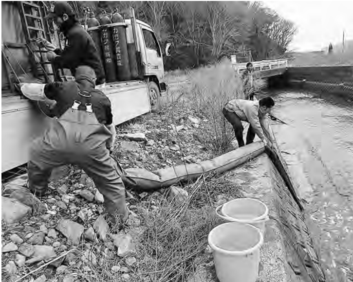
さげますふ化場の再建は？

Q 震災から早や5年9カ月、いまだに被災した御前浜のふ化場建設の見通しがたつていません。昨年は震災前に放流した稚魚が回帰する最後の年でもありませんが、平成28年の回帰率は5・7割でした。そこで、過去4年間のサケの回帰率の推移と市場への影響度は震災前と比較して、いかがですか。