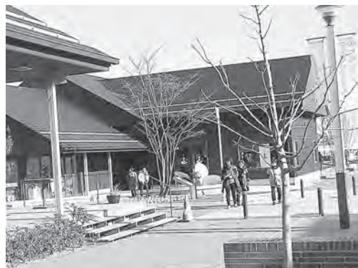
小規模事業者が集う商店街

以上が主な意見である。県内町村で初めての小規模事業者に添った条例となるが、今回の条例制定の基本的理念は経済団体および商工会や小規模事業者の意見を多く取り入れ、多くの事業者の一助となることが考えられる。