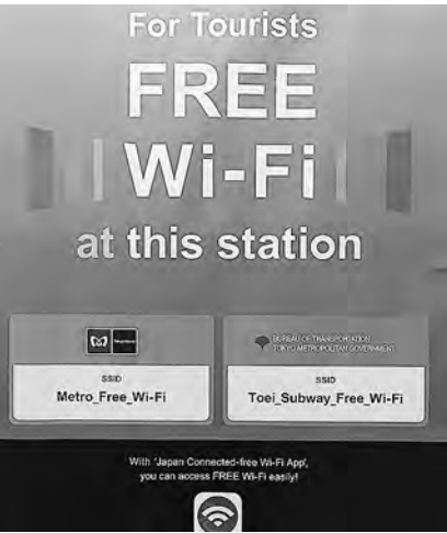
女川から世界基準へ

5年後、10年後を想定した場合、どのような取り組みを今のうちからしておくべきなのか、常に意識し、今後も最善の努力をしながら、不断に考えていきます。