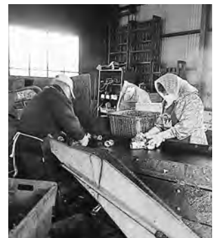
ボトルのフタを はずしましょう

女川のクリーンセンターで、分別作業を見、説明を聞いた折、ラベルやフタの付いたままのペットボトルが多く見られました。監査委員からも、資源物選別委託料1265万余円等、町民や企業の努力で町の負担が軽減すると指摘されています。 ゴミに対する関心を高めるために ①行政区などへの出前講座、催してコーナーを設ける取り組みを図っては。 ②小・中学生に、ゴミの分別見学、体験を。